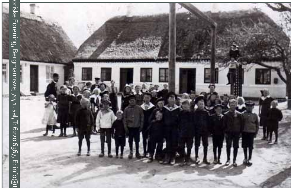
Grasten Skole, Flagebakken 217, ca. år 1912

Thurø Lokalhistoriske Forening, Bergmannsvej 70, 1. sal, T: 6220 6367, E: info@thuroarkiv.dk